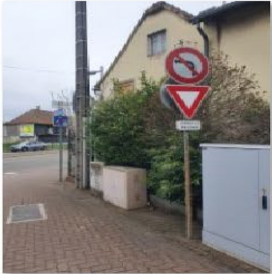
🔄 Rue Oberwiller 2