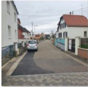
🔄 Rue Mal Logis Gill 2