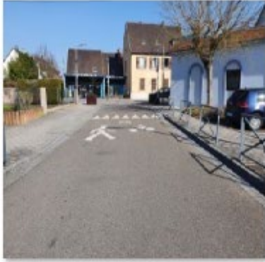
🔄 Rue de l'école 1