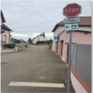
🔄 Rue Oberwiller 1