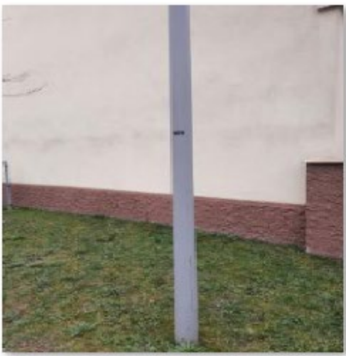
🔄 Parking EMF