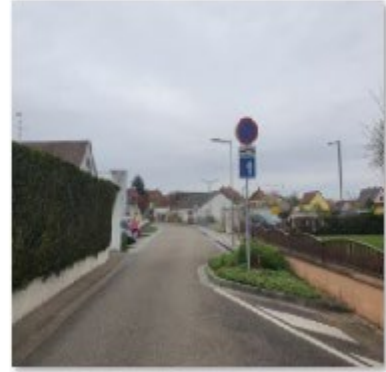
🔄 Rue de l'école 2