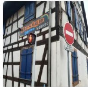
🔄 Rue Oberwiller 4