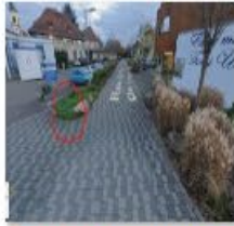
🔄 Rue Mal Logis Gill 1