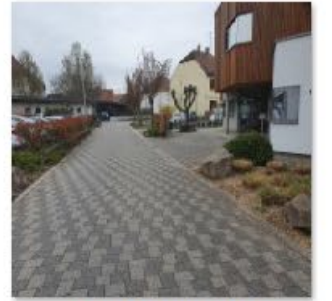
🔄 Rue Mal Logis Gill 4