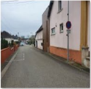
🔄 Rue de l'école 3