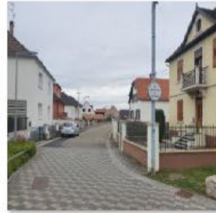
🔄 Rue Mal Logis Gill 3