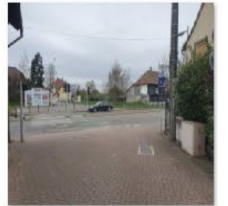
🔄 Rue Oberwiller 5