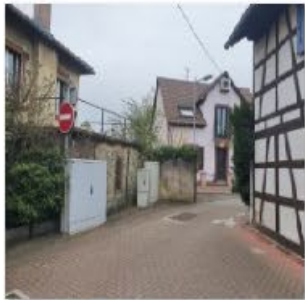
🔄 Rue Oberwiller 3